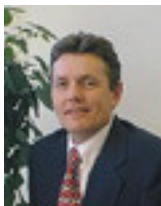
par Preston Cameron

Tout le monde s'entend pour dire que l'efficacité de la gestion est un facteur déterminant du succès ou de l'échec d'un projet dans le domaine des technologies de l'information (TI). Mais alors, n'est-il pas alarmant du point de vue des gestionnaires et des dirigeants de constater que bon nombre d'organisations ne disposent d'aucun processus normalisé pour assurer cette gestion? Un sondage mené auprès de